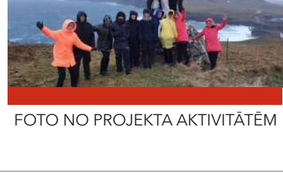
FOTO NO PROJEKTA AKTIVITĀTĒM